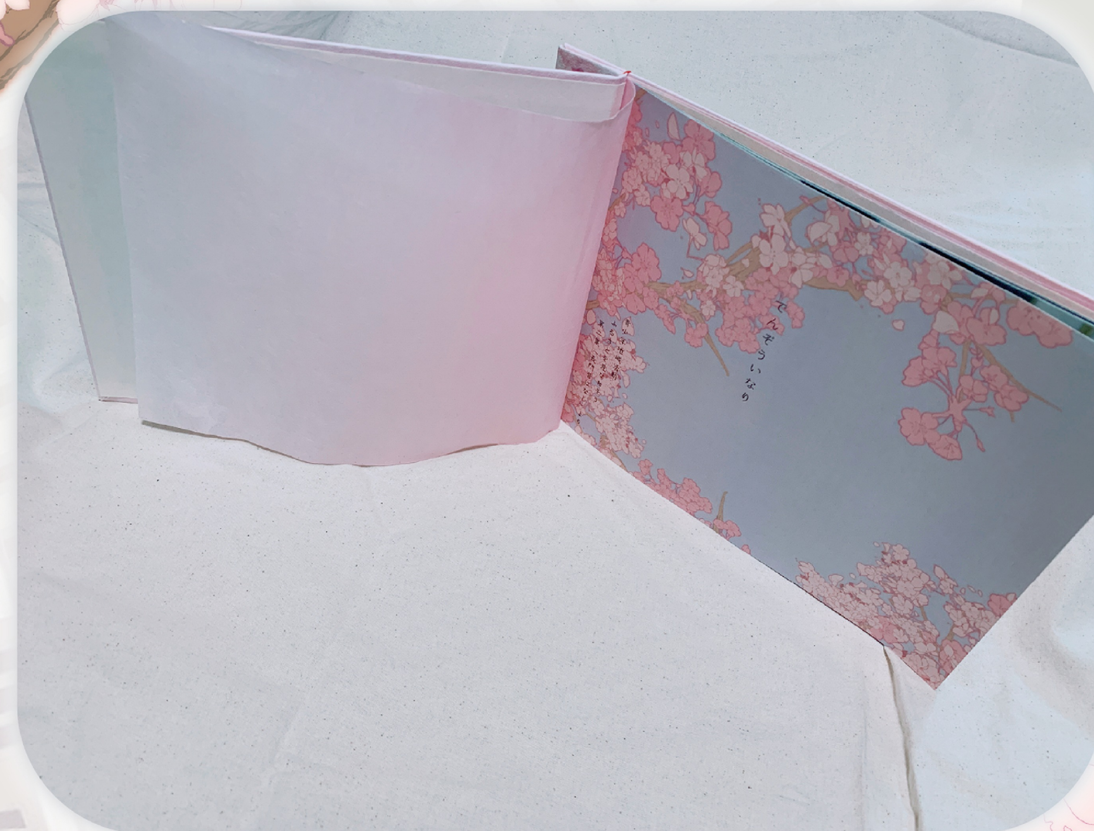
▲ 長和町では和紙が作られているということをイメージし、遊び紙を和紙にし桜色で長和町を感じられるようにしました。