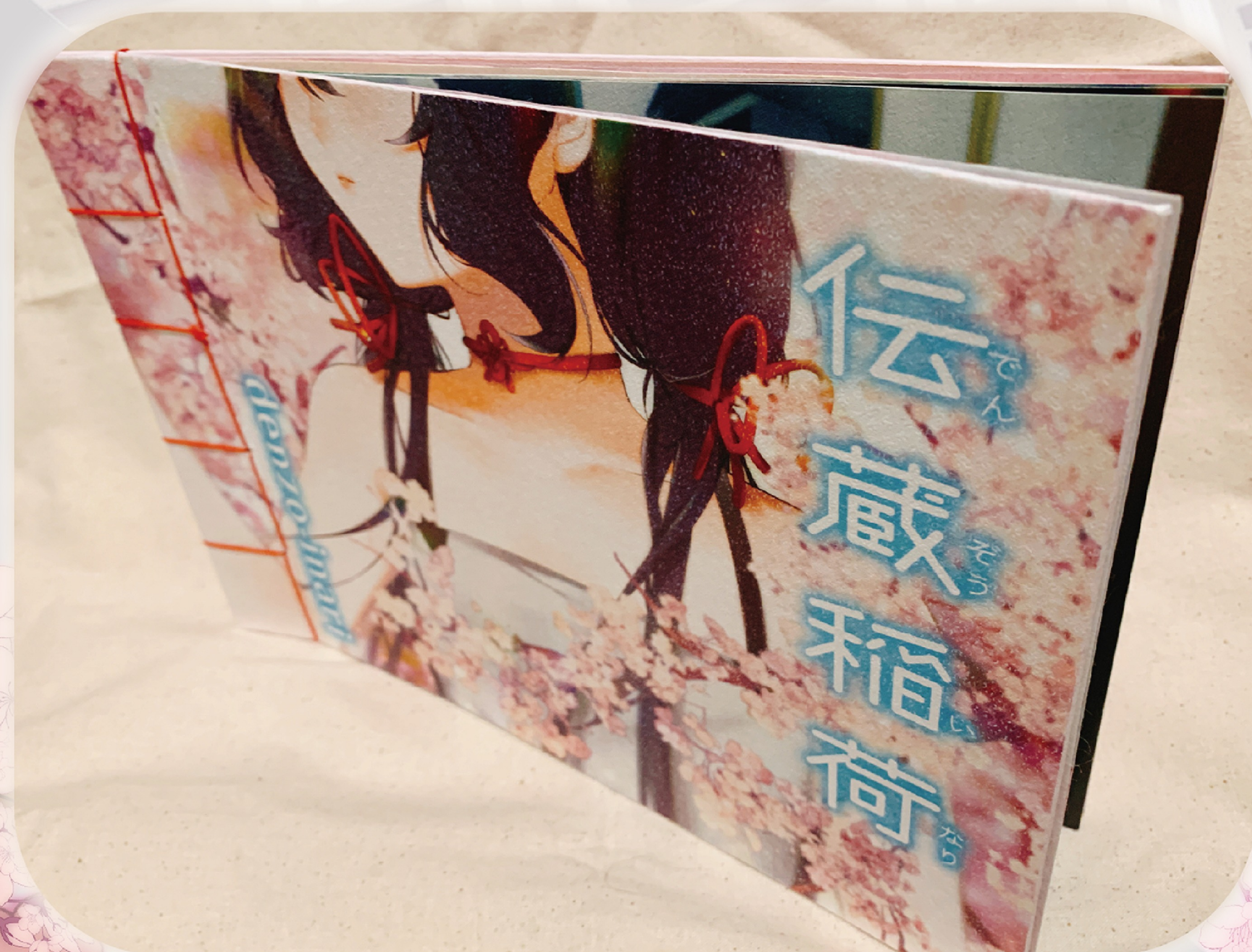
▲ 自作製本をやるにあたり、自作でしかできないようなことをしたかったので、和綴じ製本の絵本を制作しました。