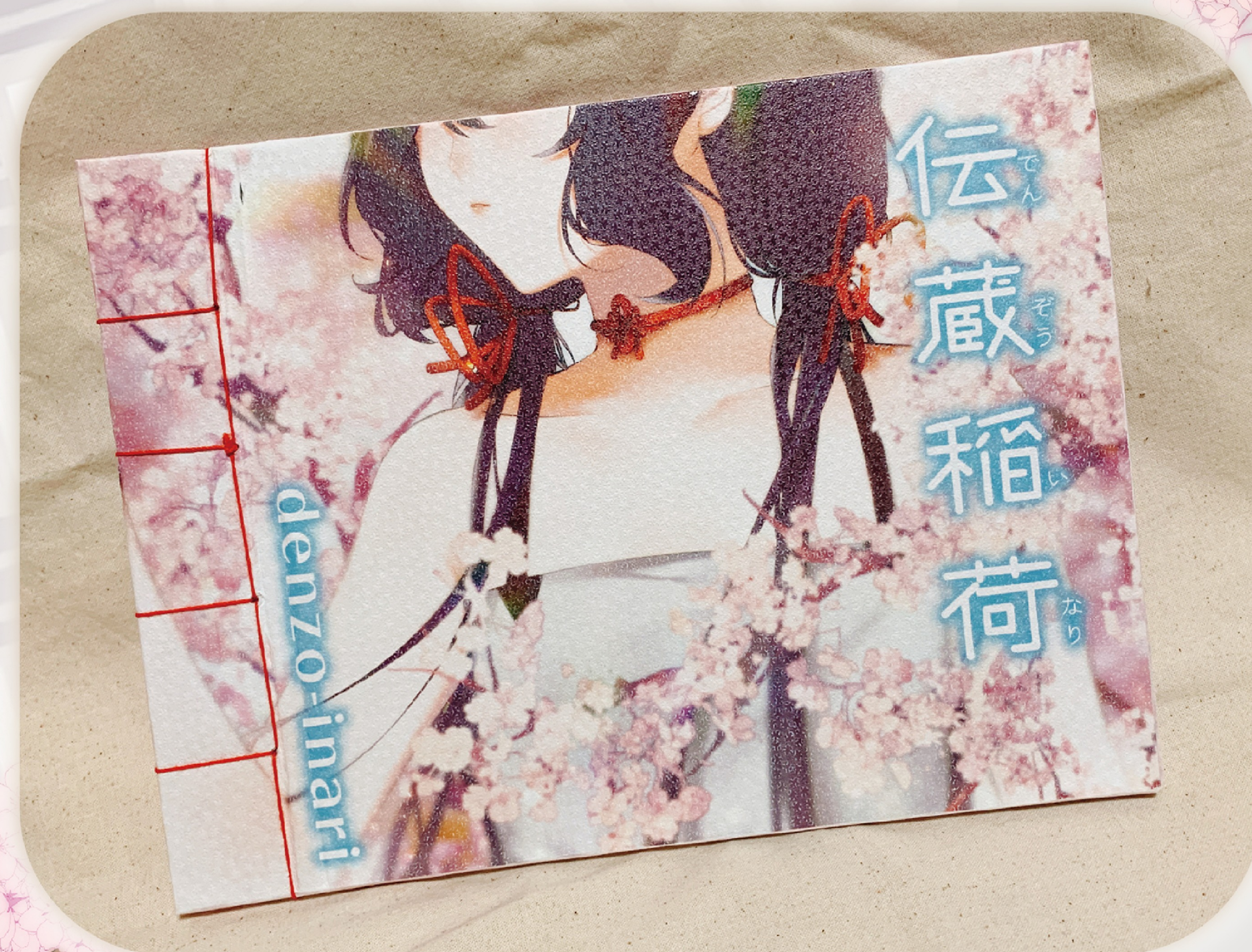
▲ 表紙は特殊紙で花形で凹凸のある紙を選び、桜をイメージしています。