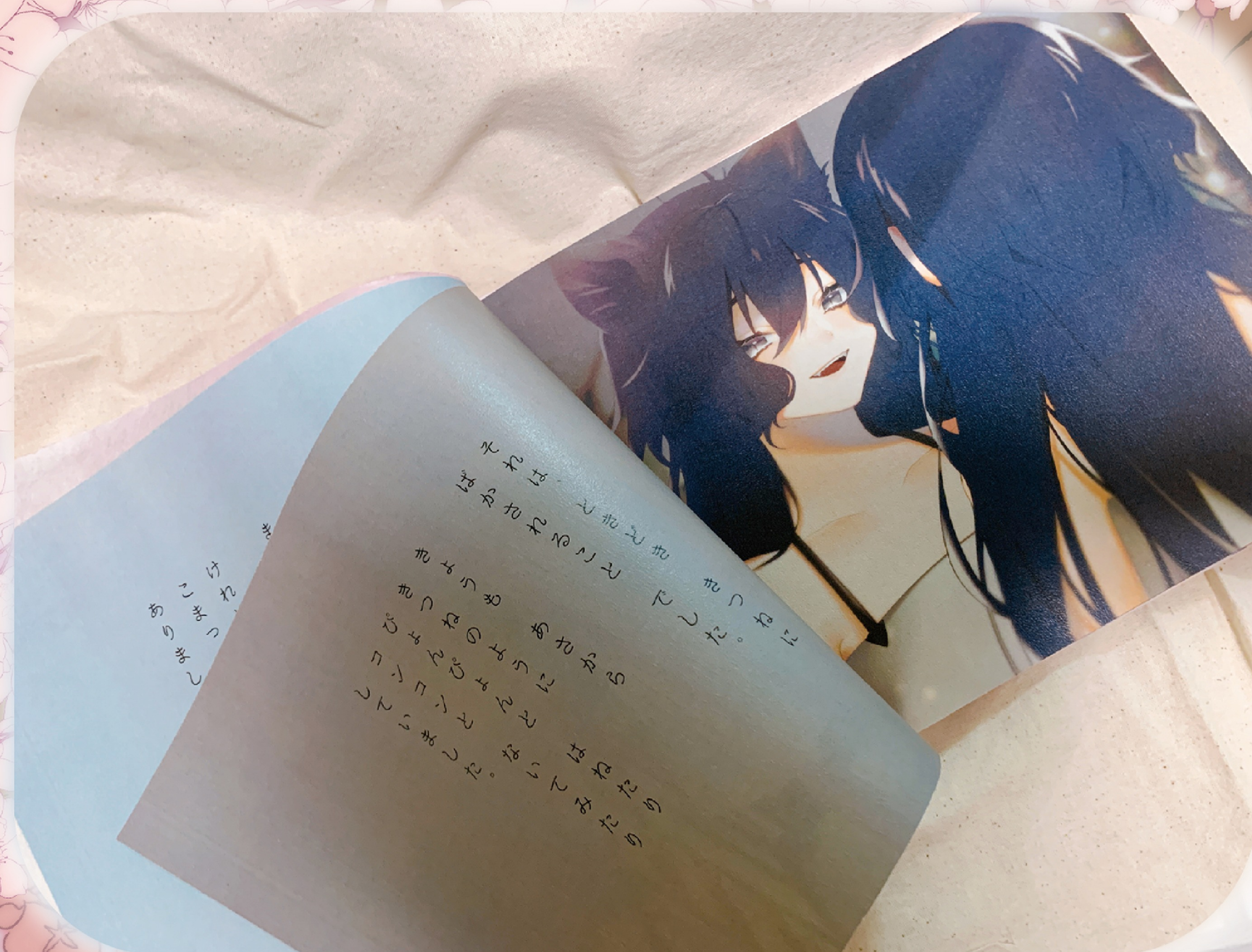
▲ 一頁ごとの文章ページはそれぞれのシーンのイメージカラーを考えました。紙は現代設定ではありませんが和風を残したかったので里紙という特殊紙を使用しました。